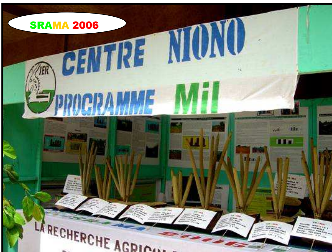
Photo : Stand du Programme Mil